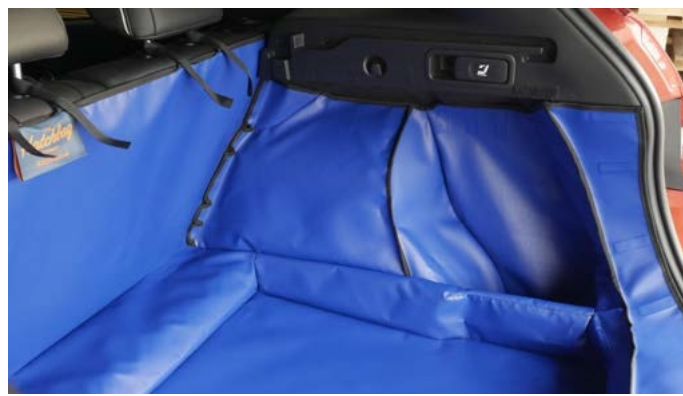
FNO - BEIFAHRESEITE