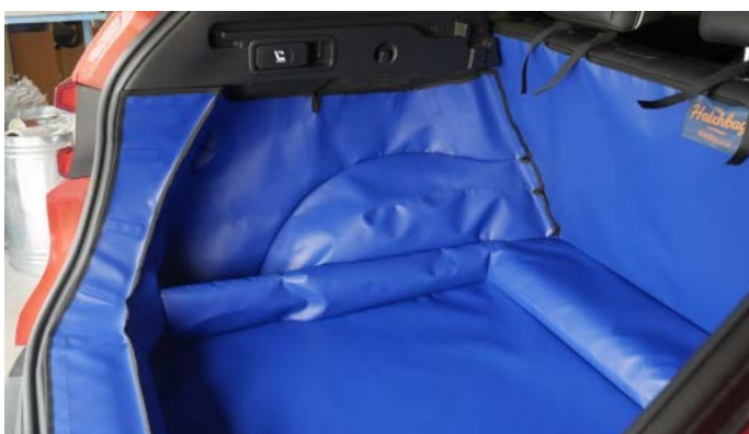
FNO - FAHRERSEITE