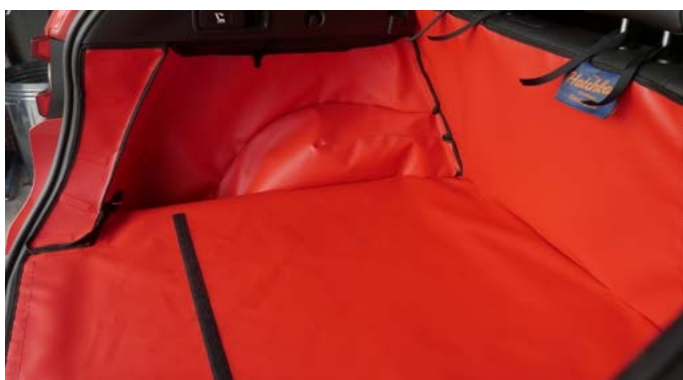
FIN - FAHRERSEITE