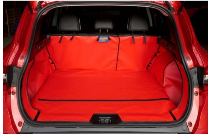
Bild oben FIN geteilter Rücksitz Version vorbereitet für den Stoßstangenschutz