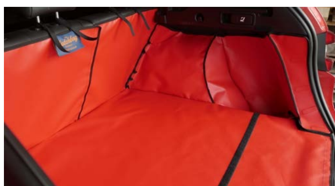
FIN - BEIFAHRESEITE