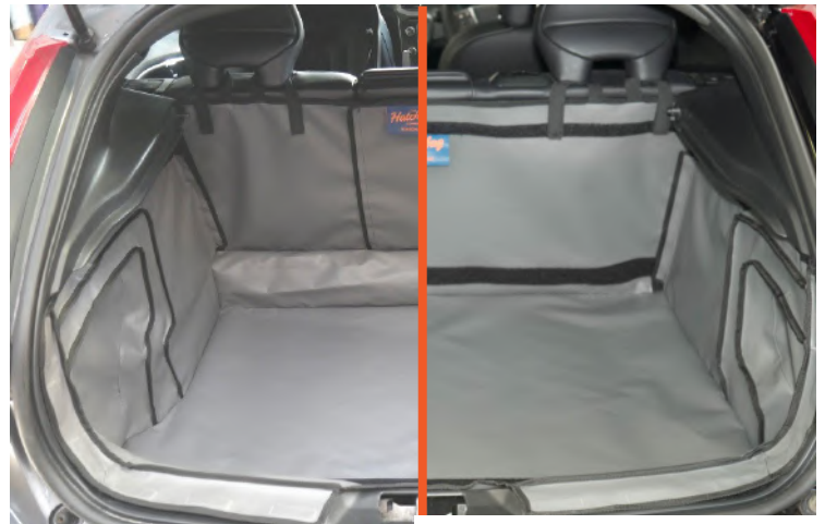
FNO Kein doppelter Boden