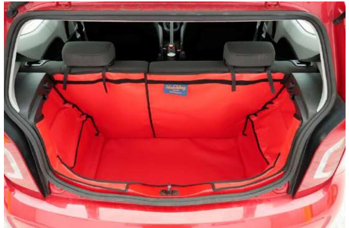
BILD ZEIGT GETEILTER RÜCKSITZ VORBEREITET FÜR DEN SITZSCHONER