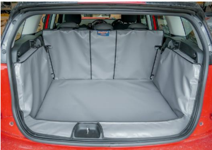
Foto: erhöhter-aufrecht geteilter Rücksitz Version