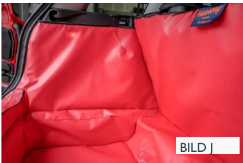
Foto: niedriger-geneigter geteilter Rücksitz Version