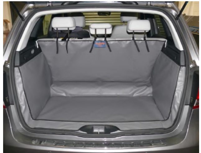
Bild zeigt niedriger Boden