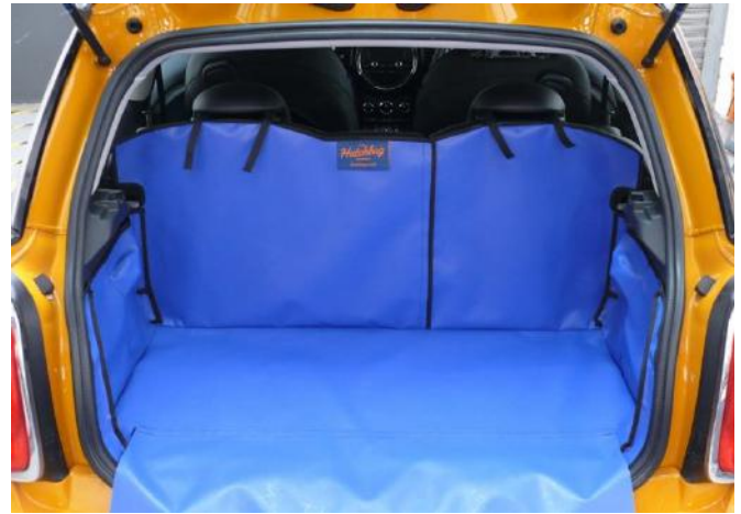
Bild: Rücksitz Plus mit Stossstangenschutz