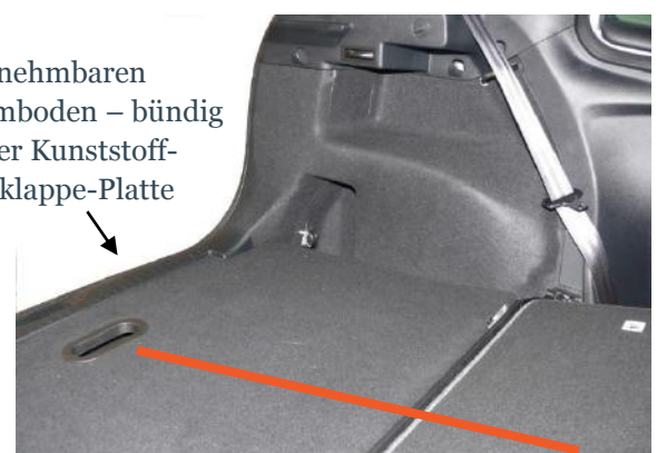
Abnehmbaren Laderaumboden – bündig mit der Kunststoff-Heckklappe-Platte