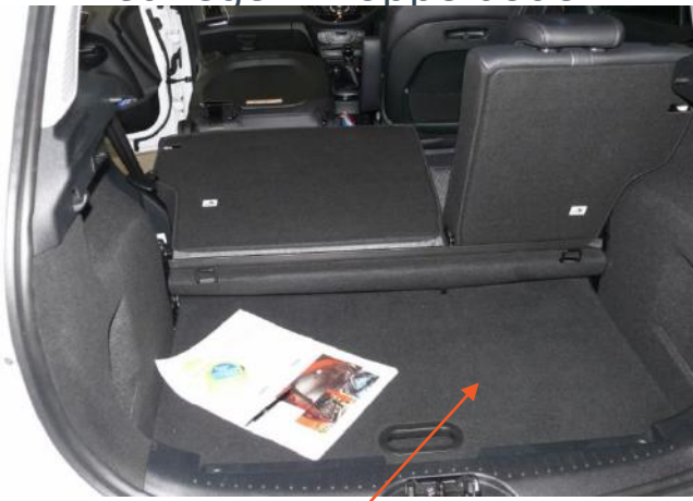
False Floor stored in the boot at its lowest level