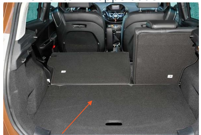
False Floor raised to its highest level