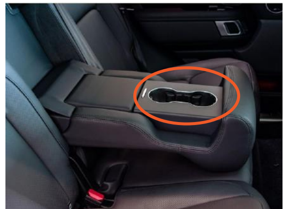
Mittelkonsole mit unbedecktem Getränkehalter

Hinter den Lehnen der Rückbank befindet sich kein zusätzlicher Abschnitt. Die Verankerung für den mittleren Sicherheitsgurt ist in die Lehne integriert.