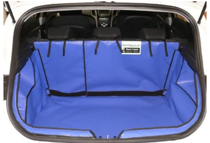
Bild zeigt geteilten Rücksitz vorbereitet für Stoßstangenschutz