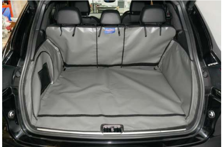
Bild zeigt Kofferraumschutz mit geteiltem Rücksitz, vorbereitet für Stoßstangenschutz und Verlängerung der Kofferraumauskleidung