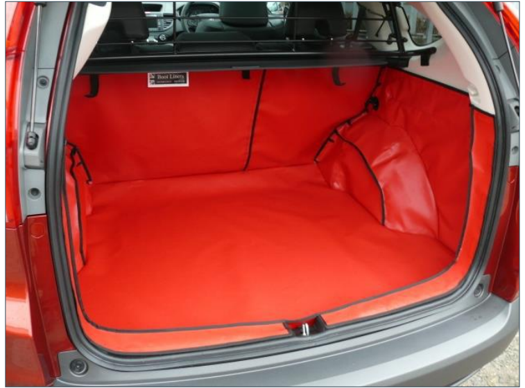
Bild zeigt geteilter Rücksitz