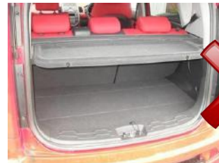
Passt nicht zu den Doppelboden

Die Kofferraumauskleidung passt nicht zu den Doppelboden oder die Ablageschale