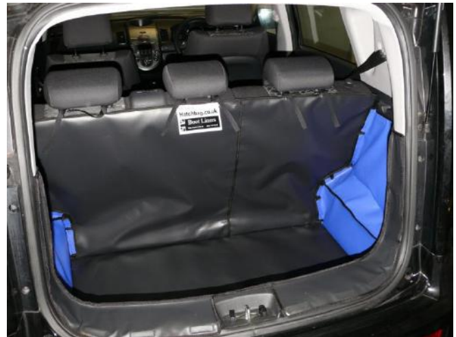
Foto zeigt geteilter Rücksitz und custom Farbe