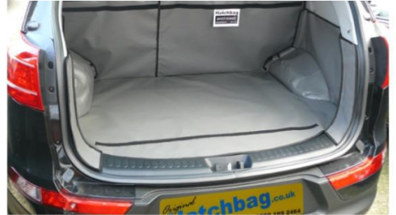
Bild zeigt geteilter Rücksitz, vorbereitet für der Stoßstangenschutz und Sitzschoner