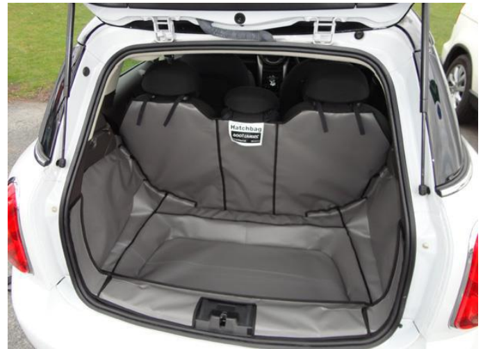
Bild zeigt geteilter Rücksitz

Stellen Sie die Rücksitze in eine aufrechte Position. (Bitte beachten Sie, dass die Position der Sitze nicht zu weit nach vorne geneigt ist um den Sitzkomfort zu bewahren)