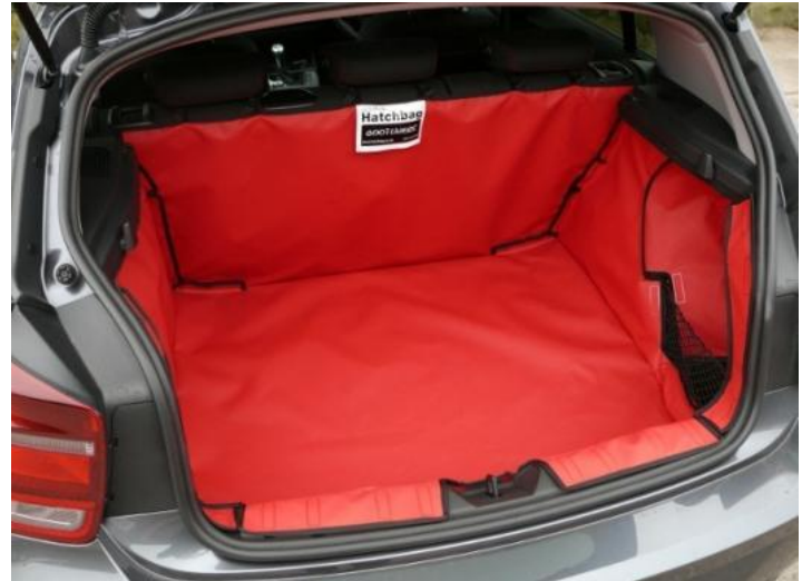
Kofferraumvariante: Mit Kunststoffeinsatz