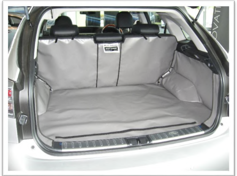
Foto: geteilter Rücksitz version vorbereitet für den Stossstangenschutz

Mindestens 8 selbsthaftende Schlaufen-Klettbander