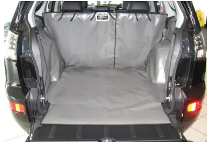
Foto zeigt geteilter Rücksitz Version