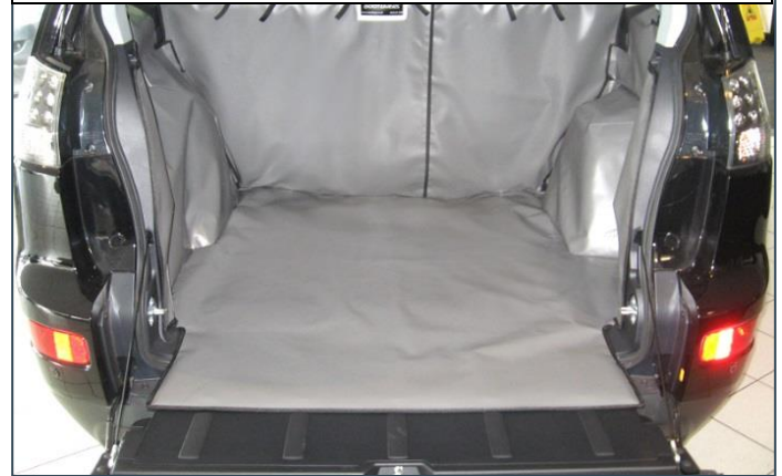
Foto zeigt geteilter Rücksitz